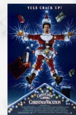
Le sapin a des boules (1989)