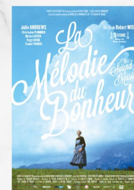
Mélodie du bonheur (1965)