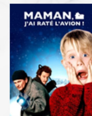
Maman, j'ai raté l'avion ! (1990)